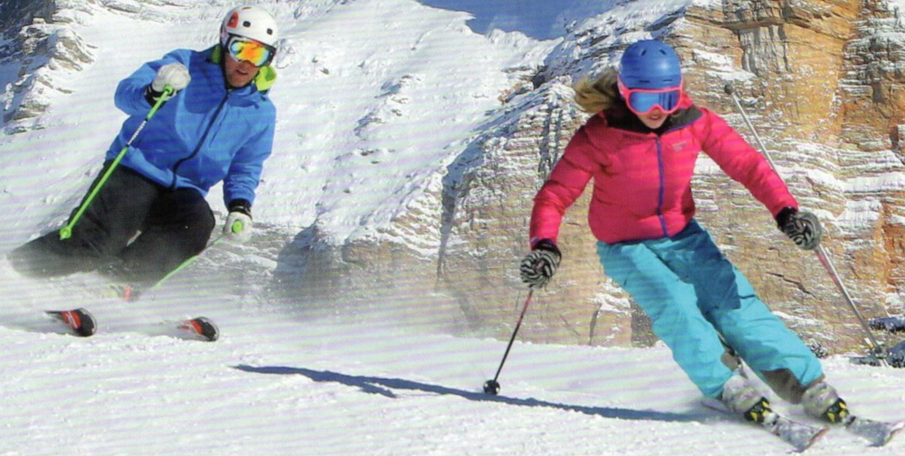
DALLA DINETTE ...