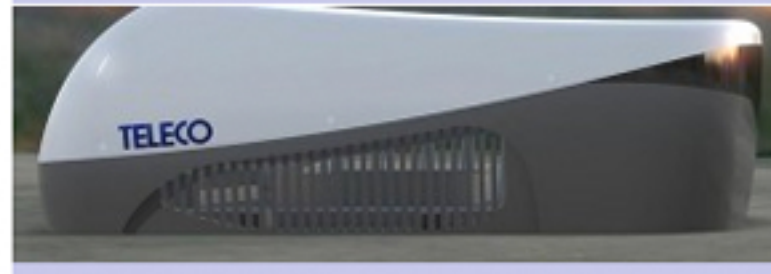
Telair e il nuovo gas refrigerante R32