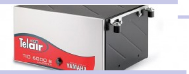
Telair presenta il nuovo generatore TIG 6000 B