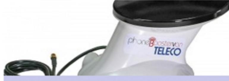
Teleco PhoneBoosterVan 2.0