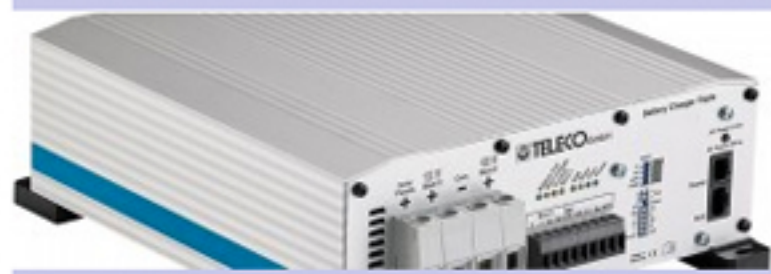
Teleco, i nuovi caricatori TBC3i PRO