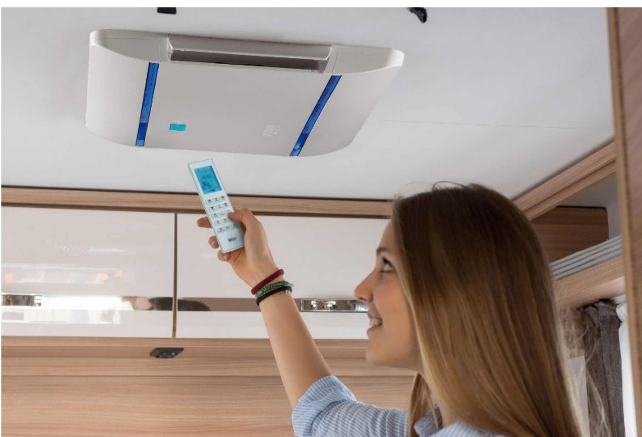
Teleco condizionatore per camper Telair Silent Plus 5900 H

Il nuovo Silent Plus 5900H di Teleco sostituisce il modello Silent 5400H e, come il modello più potente Silent Plus 8100H, presenta un nuovo diffusore, più moderno, efficiente, sottile e con caratteristiche tecniche e tecnologiche avanzate