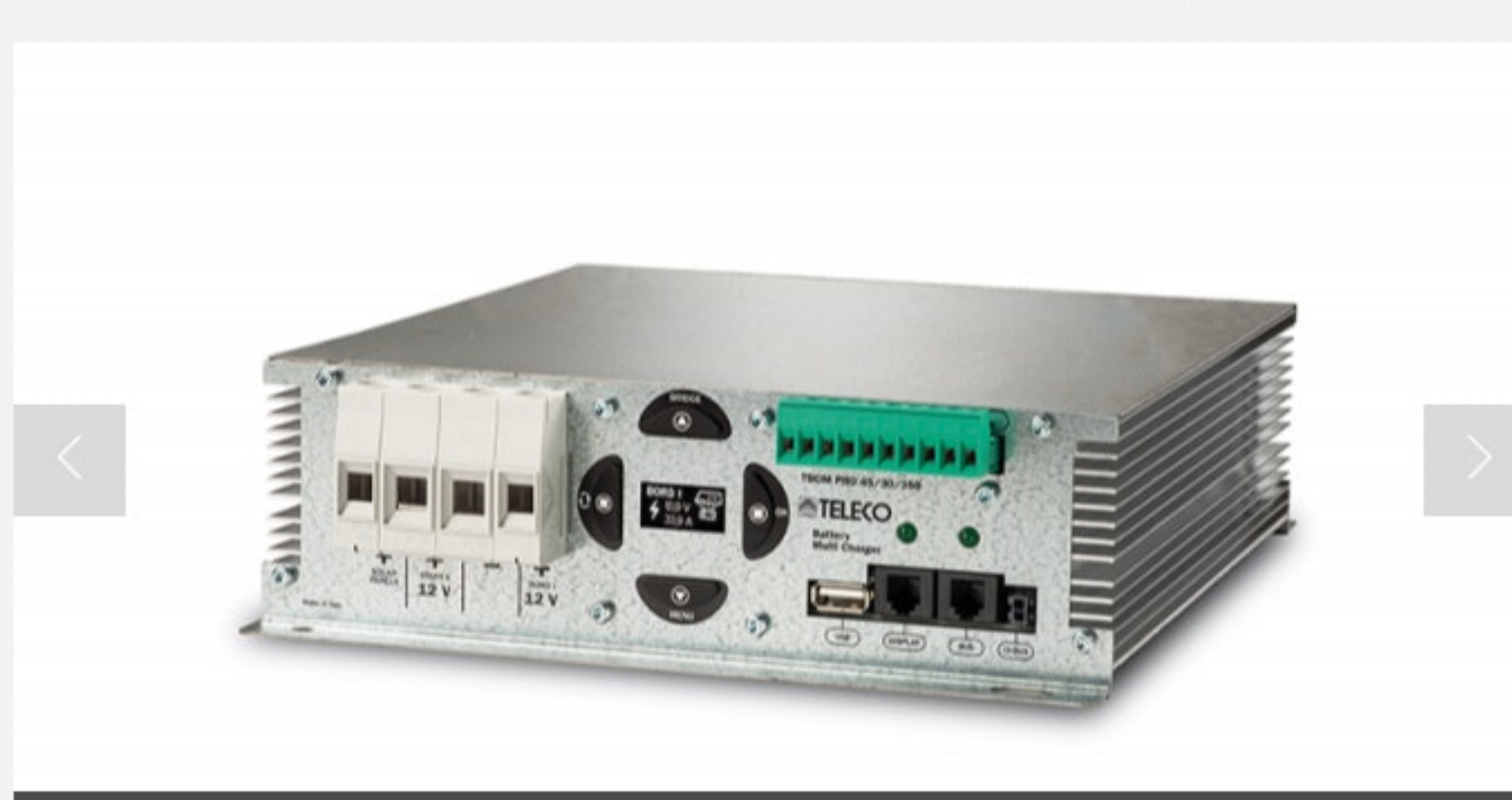
Multi-chargeur Teleco TBCM PRO 45/30/350

L'équipementier transalpin présente une version améliorée de son multi-chargeur pour camping-car. Le Teleco TBCM PRO 45/30/350 peut gérer automatiquement l'alimentation de batteries auxiliaires en choisissant les meilleures sources de courant à sa disposition.